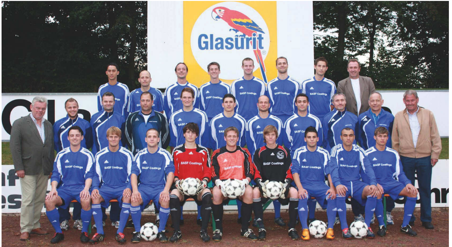
Foto 1: Das Team der 1. Mannschaft des TuS Hilstrup Saison 2009/10, in der Landesliga 4.