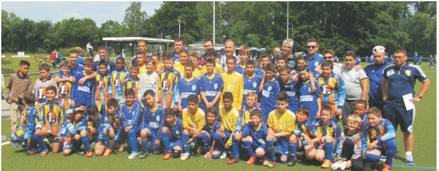
Zuletzt waren unsere Freunde aus Beaugency vor zwei Jahren beim TuS Hilstrup zu Gast und erlebten mit ihren Gastfamilien eine schöne Zeit.