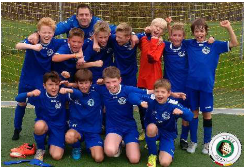
Im Kreispokal weitergekommen sind unsere Nachwuchskicker und -kickerinnen. In der 1. Runde gewannen die Junioren der U11-1 bei der Warendorfer SU 8:1, die U11-Mädchen kamen mit einem 8:7-Erfolg aus Senden zurück.

Sonntag, 24.04.2016 11:00: SpVgg Vreden - TuS Hilstrup U17-1