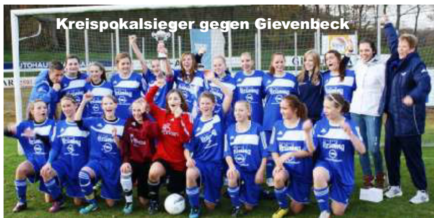
Kreispokalsieger gegen Gievenbeck

Zweimal sind wir Meister geworden, doch den Aufstieg in die Bezirksliga haben wir verpasst. Vielleicht klappt es ja in dieser Saison mit der U17 - die Chancen stehen sehr gut!