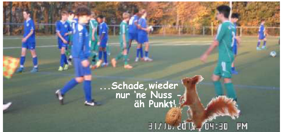
...Schade, wieder nur 'ne Nuss - äh Punkt!