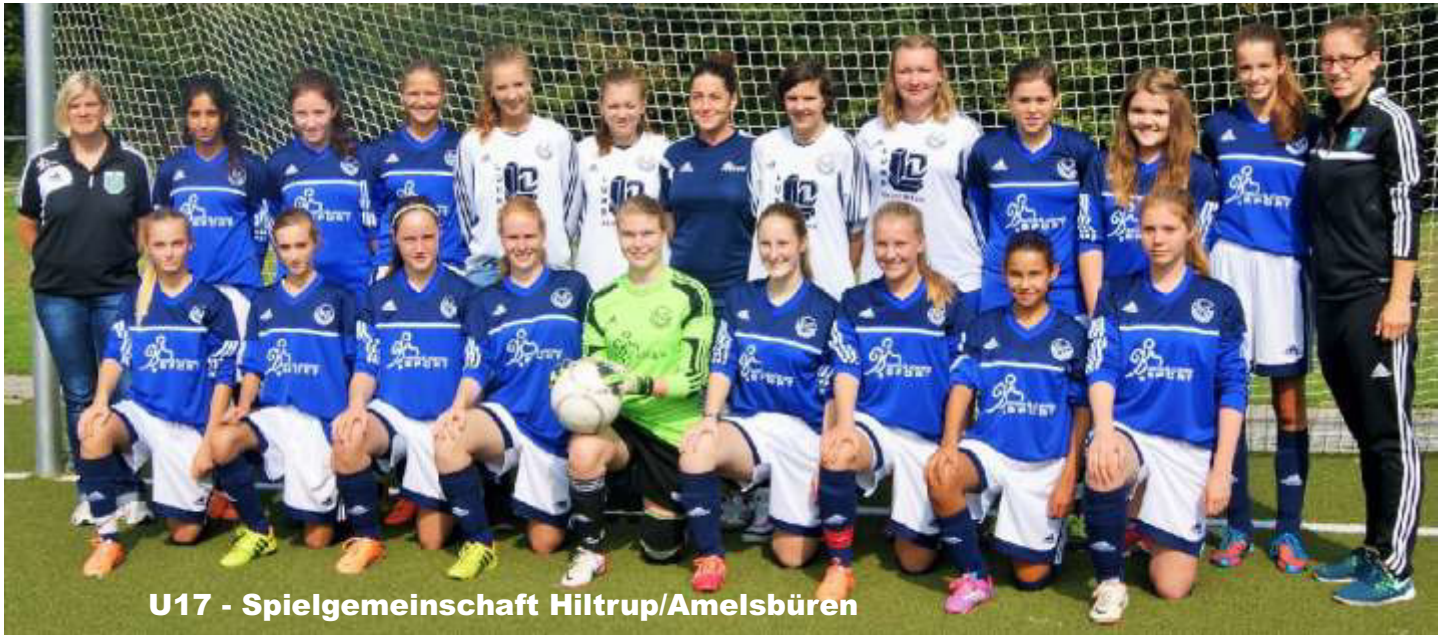
U17 - Spielgemeinschaft Hilstrup/Amelsbüren