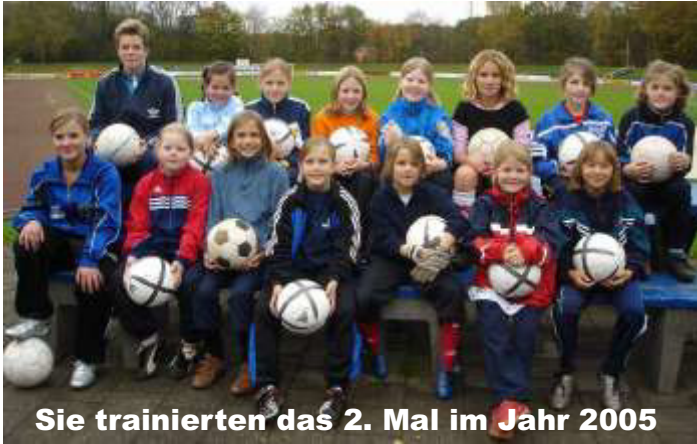
Sie trainierten das 2. Mal im Jahr 2005

Einstimmig hatte der Vorstand der Fußballabteilung auf seiner letzten Sitzung im Jahre 2005 beschlossen, den vielen Wünschen nach Mädchenfußball nachzukommen. Gestartet wurde dann am 19. Oktober 2005 um 15.30 im Stadion Hilstrup-Ost.