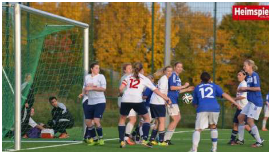
Dicke, dicke Luft im Wacker Fünfer. In dieser Szene zappelte der Ball allerdings noch nicht im Tor.