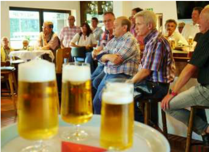
Mitglieder und Gäste feierten mit und schauten interessiert den Videopräsentationen im neuen Clubheim zu.