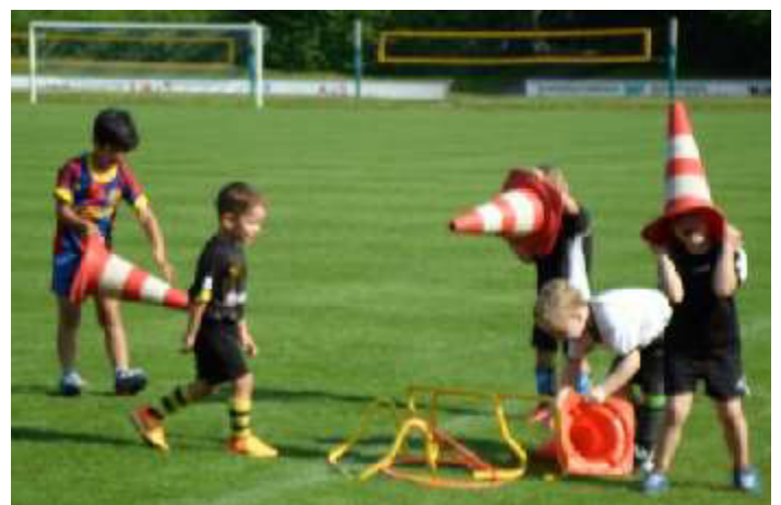
...uff - jetzt dürfen wir auch noch mithelfen aufzuräumen!