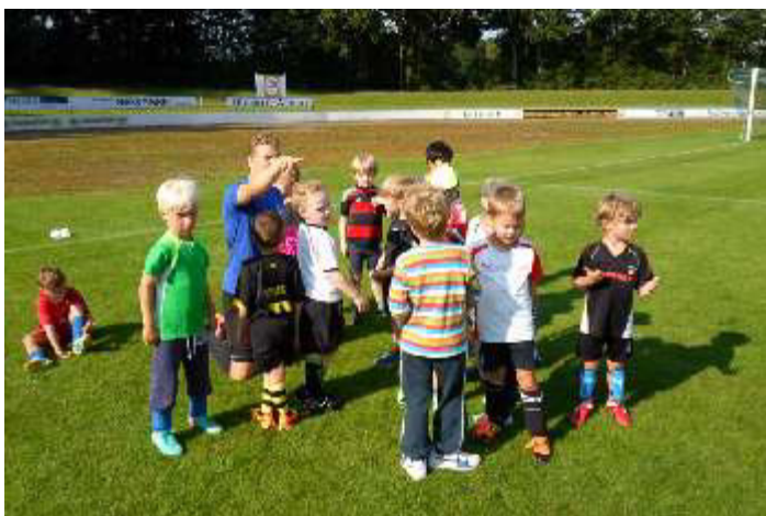
Jungs, schaut genau dahin. Da ist der Ball und euer Gegenspieler. Habt den Ball und den Spieler fest im Auge. Ihr packt es schon. Und nun los!

Dabei haben die Kinder die Möglichkeit ihren natürlichen Bewegungsdrang auszuleben und erfahren dabei die Freude am Sport treiben. Eine Spielstunde garantiert Kindern, mit Hilfe einer kindgerechten-spielerischen Vermittlung, vielseitige Bewegungserlebnisse. Die Inhalte der Spielstunden sind aufeinander systematisch abgestimmt. Diese vermitteln den Kindern vielfältige motorische Fähigkeiten und stellen somit die Grundlage für ein zukünftiges bewegtes Leben. Hauptinhalte der Spielstunden sind deshalb Fang-, Lauf- und Tummelspiele. Neben dem steht die Beschäftigung mit springenden, rollenden und geworfenen Bällen im Vordergrund. Auch die ersten Erfahrungen im Wettkampf gegen andere Mannschaften wird alle vier Wochen in kleinen Freundschaftsturnieren vermittelt.