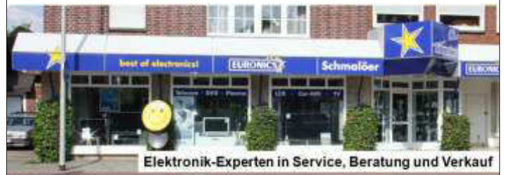
Elektronik-Experten in Service, Beratung und Verkauf