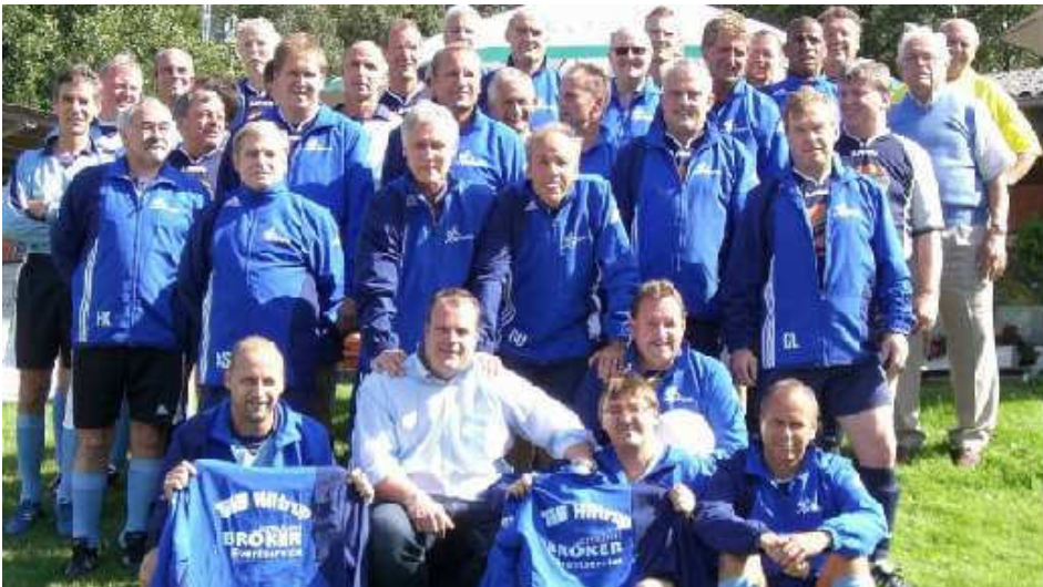
...Auch sie sind noch dabei: Die "Alten Herren" des TuS Hilstrup! Die gestandenen Kicker können noch einigen jüngeren etwas beibringen. Auch sind sie sehr unentbehrlich bei vielen Aktionen der Fußballabteilung. "Danke, ihr "Alten"!!!