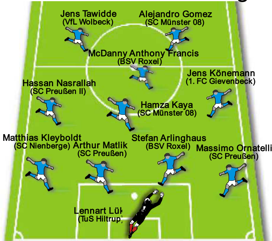
Aufgestellt von der Sportredaktion der MZ am 02.11.2008