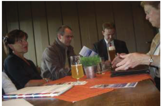
Die Fraktionsmitglieder informieren, wie sie Pate für ein Stück Kunstrasen werden können.

Insgesamt eine gelungene Veranstaltung, die auch nach den Kommunalwahlen fortgesetzt werden soll / sollte.