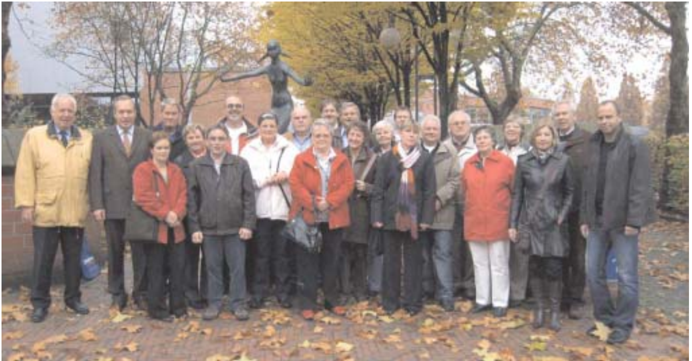
Zwei Dutzend TuS'lerinnen und TuS'ler waren bei der diesjährigen Vorstandstour der Fußballabteilung dabei. Interessant war der Besuch der ehemaligen Polizeiführungsakademie, jetzt die Hochschule der Deutschen Polizei.