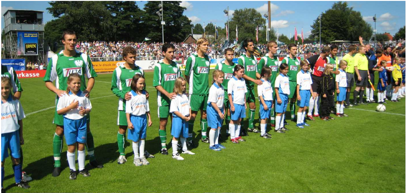
Glück brachten unsere TuS-Fußballmädchen dem SC Preußen Münster, beim Heimspiel gegen Gütersloh liefen die Kickerinnen mit den Mannschaften im Preußenstadion an der Hammerstraße auf - und die Preußen gewannen prompt 2:0! Das Spiel, das Eltern und TuS-Mädchen begeistert verfolgten, erlebten alle auf der Tribüne.