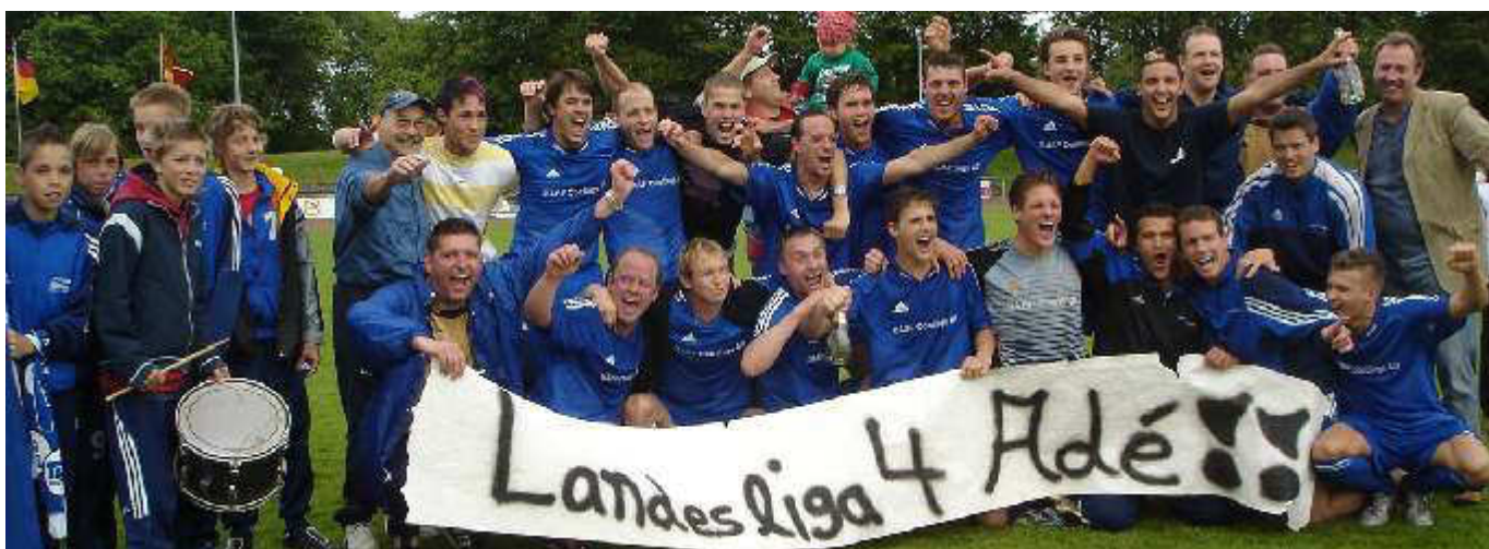
Überschwänglich feierten die Hilstruper vor zwei Jahren den Verbandsliga-Aufstieg. Im Gründungsjahr einer neuen Liga steht der TuS Hilstrup vor der nächsten Herausforderung. NRW-Liga? Westfalenliga? Egal, am Saisonende kann der TuS mit Stolz zurückblicken!

Reisener: Bislang noch nicht. Wir haben sämtliche Anträge eingereicht und warten jetzt auf eine Antwort. Wir lassen alles auf uns zukommen. Sollte es erforderlich werden, leiten wir entsprechende Umrüstungen ein.