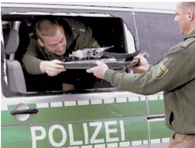
Zwei Polizisten räumen einen durch Hooligans beschädigten Einsatzwagen aus.