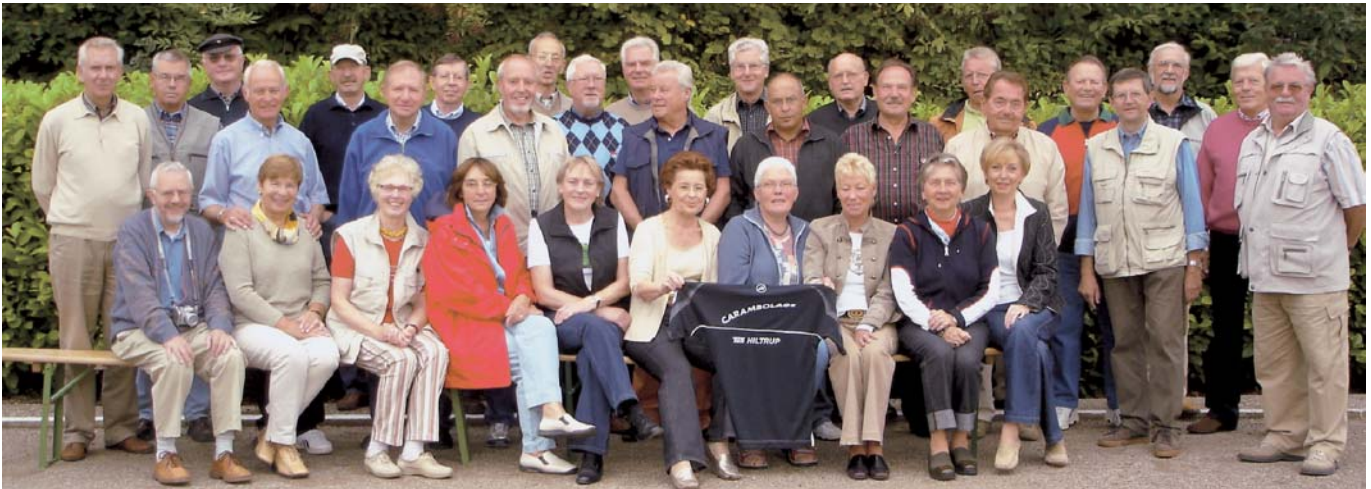
Wer wird wohl beim 4. Vereinsinternen Turnier Champ? Dreißig Bouler wetteiferten mit Schweinchen und Kugeln um die Vereinsmeisterschaft.