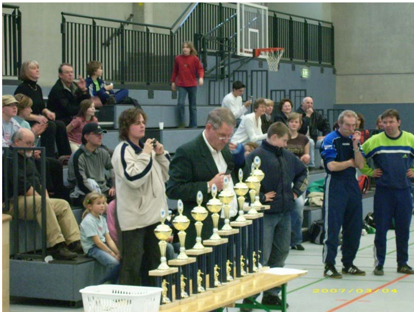
Der Kreisvorsitzende des FLVW-Kreis 24 - Münster/Warendorf - und Fußballchef des TuS Hilstrup staunte über die tollen Pokale, die er den Siegern des Turniers überreichte.