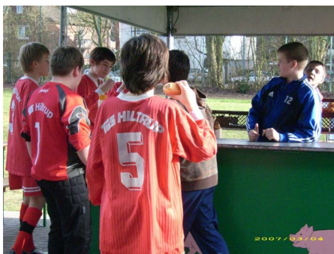
Fußballspielen macht hungrig - aber da hatten die Organisatoren bestens vorgesorgt

Ein ausführlicher Bericht folgt in der nächsten Ausgabe von „TuS aktuell“.