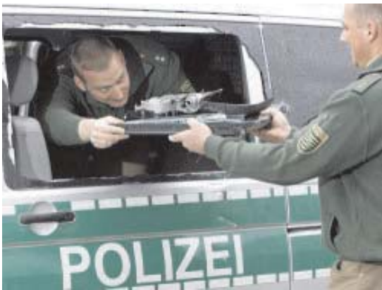
Zwei Polizisten räumen einen durch Hooligans beschädigten Einsatzwagen aus.