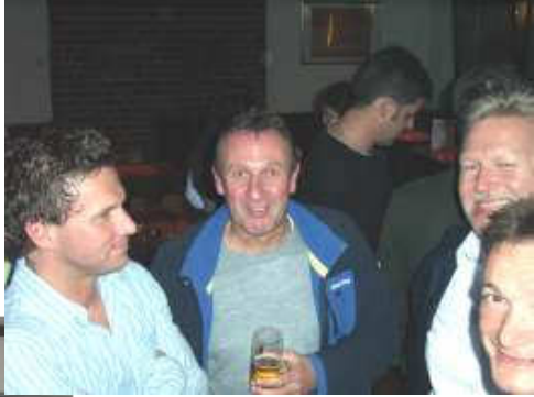
Alle sind zufrieden. Es ist aber auch kein Wunder, im sportlichen Bereich sieht es bei Senioren und Junioren gut aus!

Der Abend sei, so die einhellige Meinung aller, sehr wichtig gewesen für das Leben der Fußballabteilung, da er die Zusammenarbeit und die Kameradschaft gewiss fördern werde.