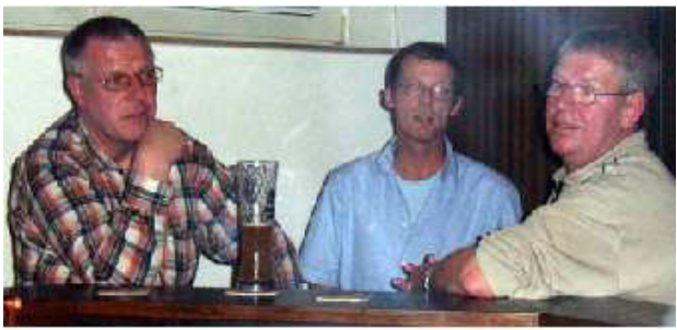
Am Sonntag werden hoffentlich wieder alle fit sein, wir wollen aufsteigen!

Bei Imbiss und Getränken, deren Kosten aus dem Vertrag mit der Bitburger-Brauerei bestritten wurden, kam es zu fachlichem Gedankenaustausch, zu amüsanten Konversationen, zu lustigem Geplapper.