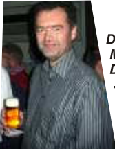
Der "Schatzmeister" strahlt: Der Etat für den Sportlichen Bereich wird nicht angetastet

Bei Imbiss und Getränken, deren Kosten aus dem Vertrag mit der Bitburger-Brauerei bestritten wurden, kam es zu fachlichem Gedankenaustausch, zu amüsanten Konversationen, zu lustigem Geplapper.